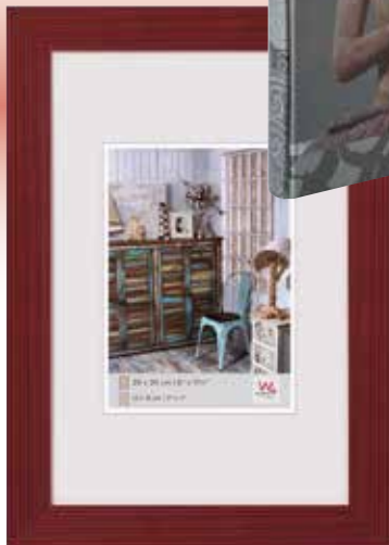
Warme Töne dominieren die Produktlinie „Ethnic Chic“.