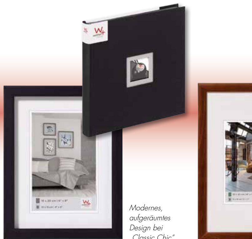
Modernes, aufgeräumtes Design bei „Classic Chic“.