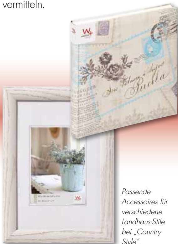
Passende Accessoires für verschiedene Landhaus-Stile bei „Country Style“.

Alle aktuellen Produkte von walther design sind jetzt in fünf spannende Wohnwelten unterteilt, deren Charakter auf speziell abgestimmten Einlegern anschaulich gezeigt wird. Das auf den Verpackungen prominent plat-