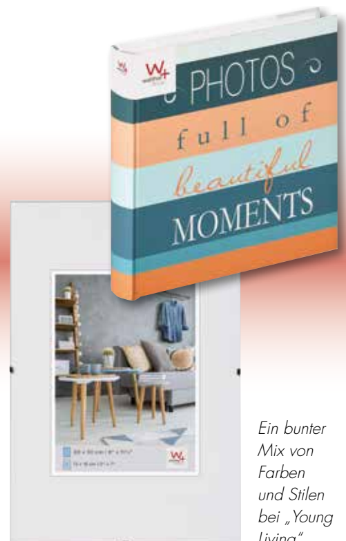
Ein bunter Mix von Farben und Stilen bei „Young Living“.