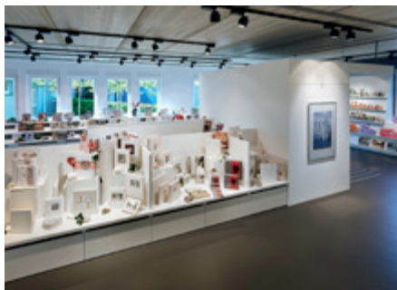
Die walther design Produktvielfalt – unser Sortiment umfasst über 3.000 Artikel.