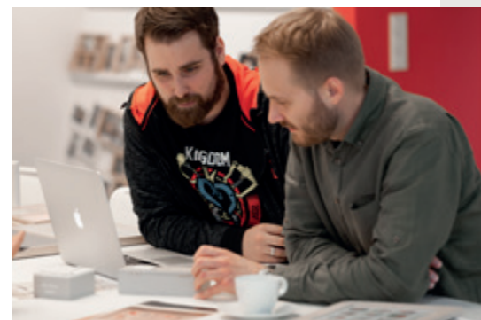
Wir arbeiten an kreativen Ideen und den Trends von morgen.

Neue Impulse, neue Kunden. Mit verschiedenen, aktuellen Style-Welten geben wir kreative Anregungen und eröffnen Ihren Kunden unzählige Gestaltungsmöglichkeiten, um in den eigenen Räumen mit wenig Aufwand neue, stilvolle und überraschende Akzente zu setzen. Was alle Stilrichtungen vereint: Die Liebe zum Detail, aufwändige Produktveredelungen, Trend-Farben und hochwertige Materialien.